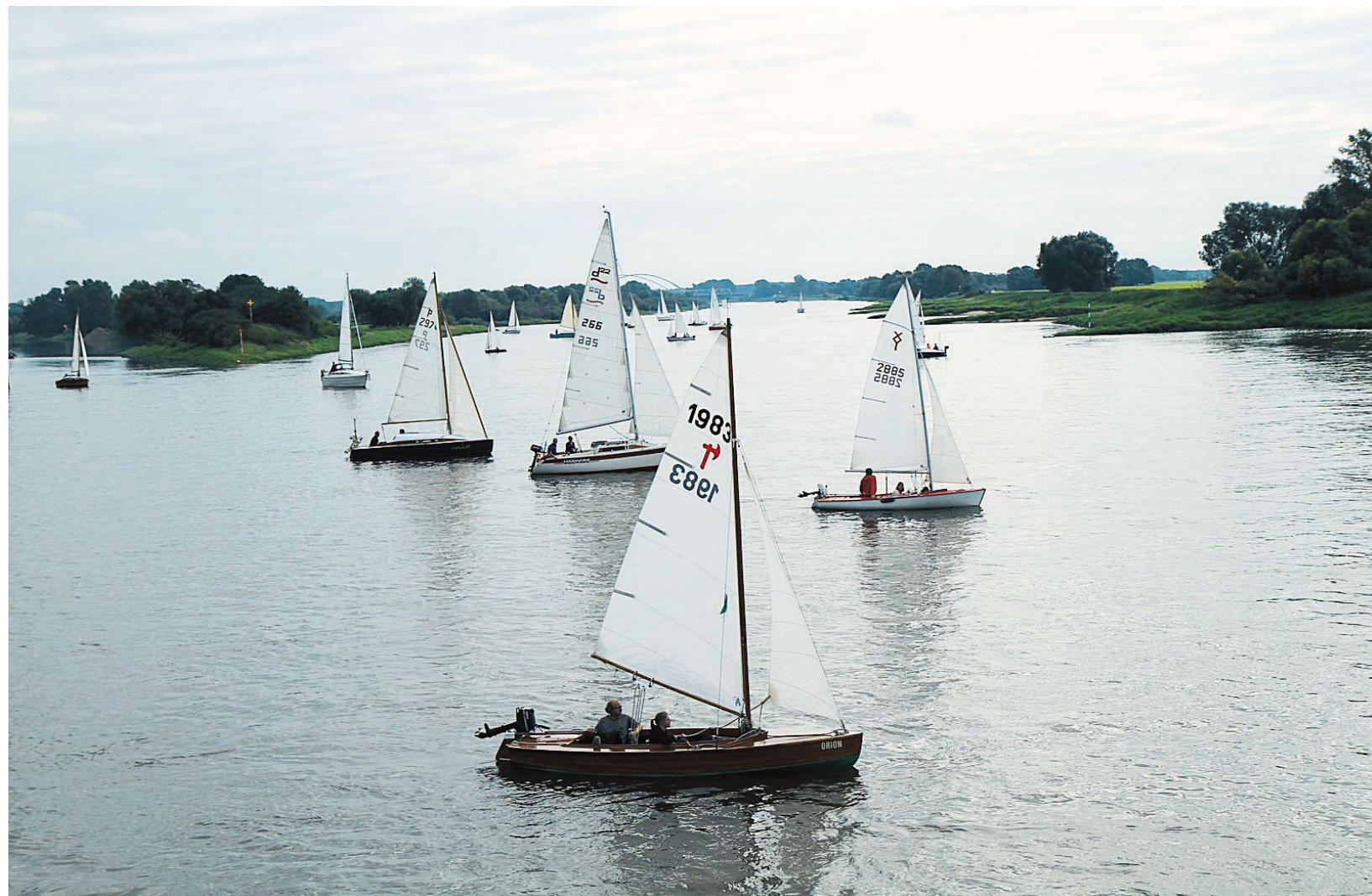
Eine besondere Herausforderung: Segeln auf der Elbe. Bei der diesjährigen Drei-Städte-Tour, die von Wittenberg über Dessau nach Magdeburg führt, waren 28 Boote mit der Partie.